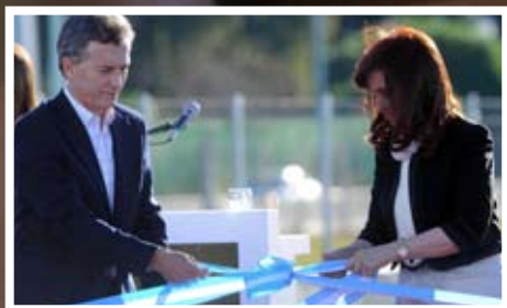
Macri y Cristina se reparten el juego

La presidenta del Consejo de la Magistratura de la Ciudad adelanta los lineamientos de su flamante gestión. Los desafíos en materia de género. La inclusión de nuevas tecnologías. Por qué asegura que el traspaso "traerá una Justicia más rápida, cercana y moderna".