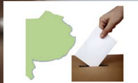
Las claves del panorama electoral bonaerense