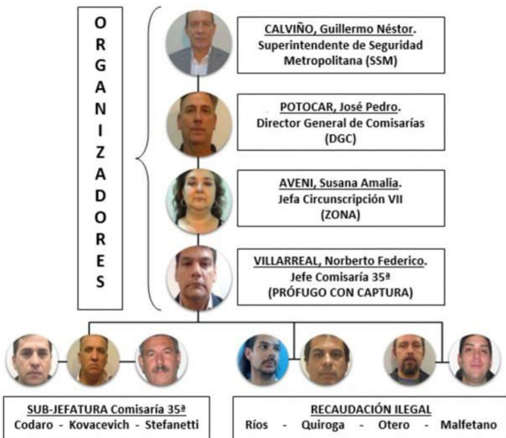
ESTRUCTURA CORRUPTA. En exclusiva, NU accedió al organigrama que figura en la causa.