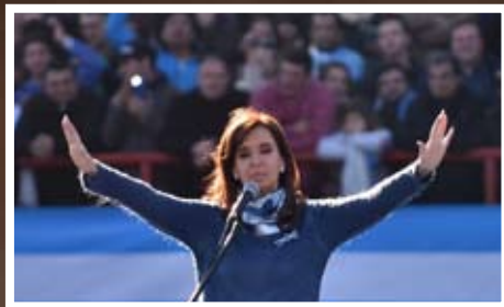
Lo que dejó el acto de CFK en Arsenal